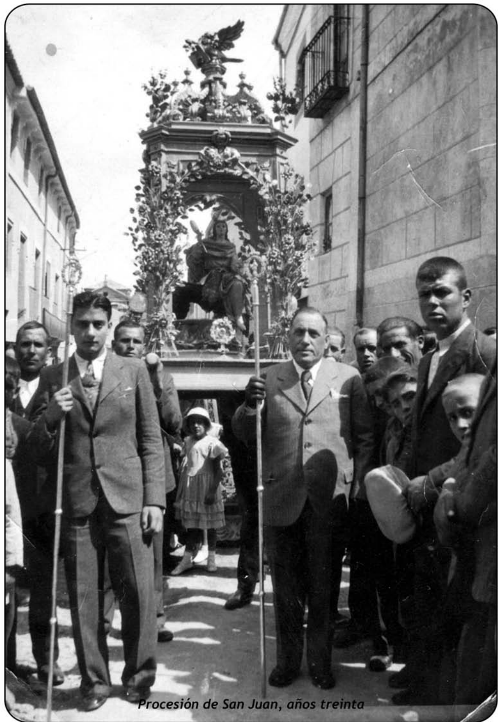
Procesión de San Juan, años treinta