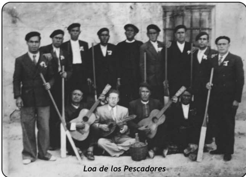
Loa de los Pescadores