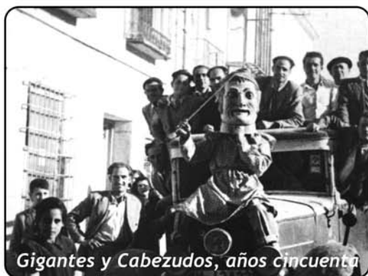
Gigantes y Cabezudos, años cincuenta