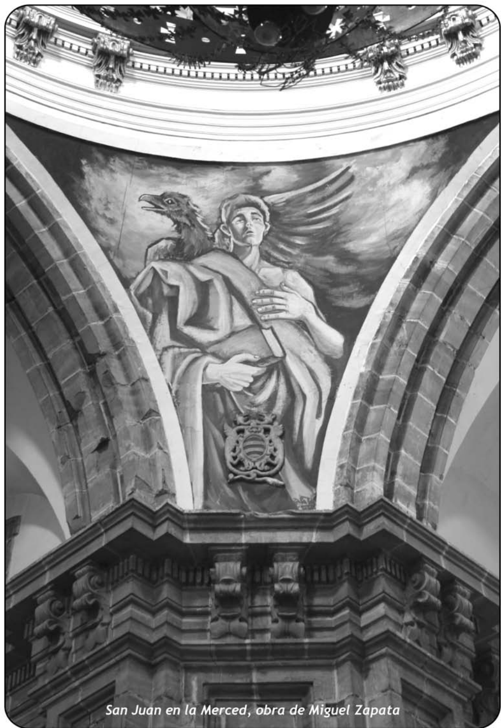
San Juan en la Merced, obra de Miguel Zapata