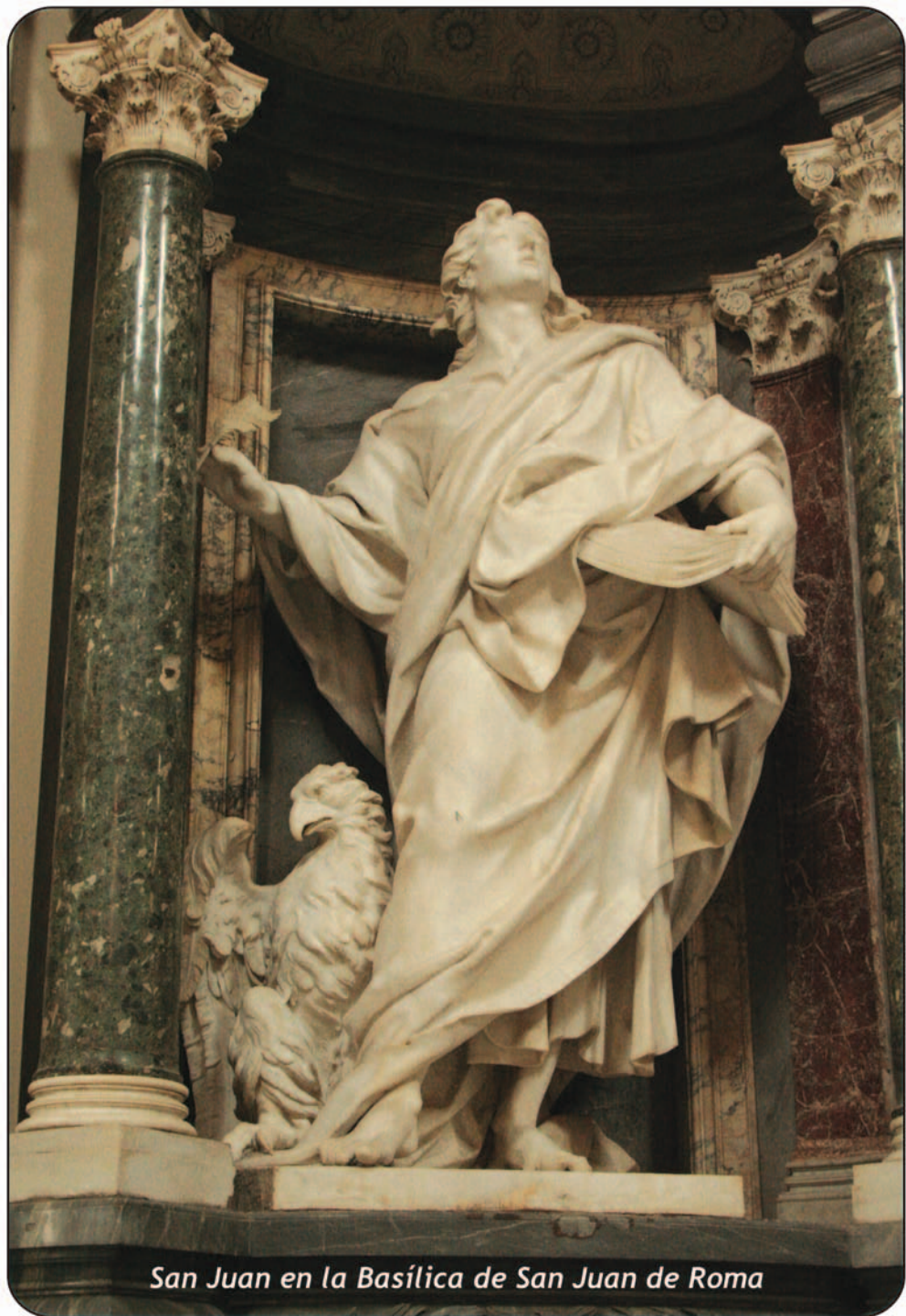
San Juan en la Basílica de San Juan de Roma