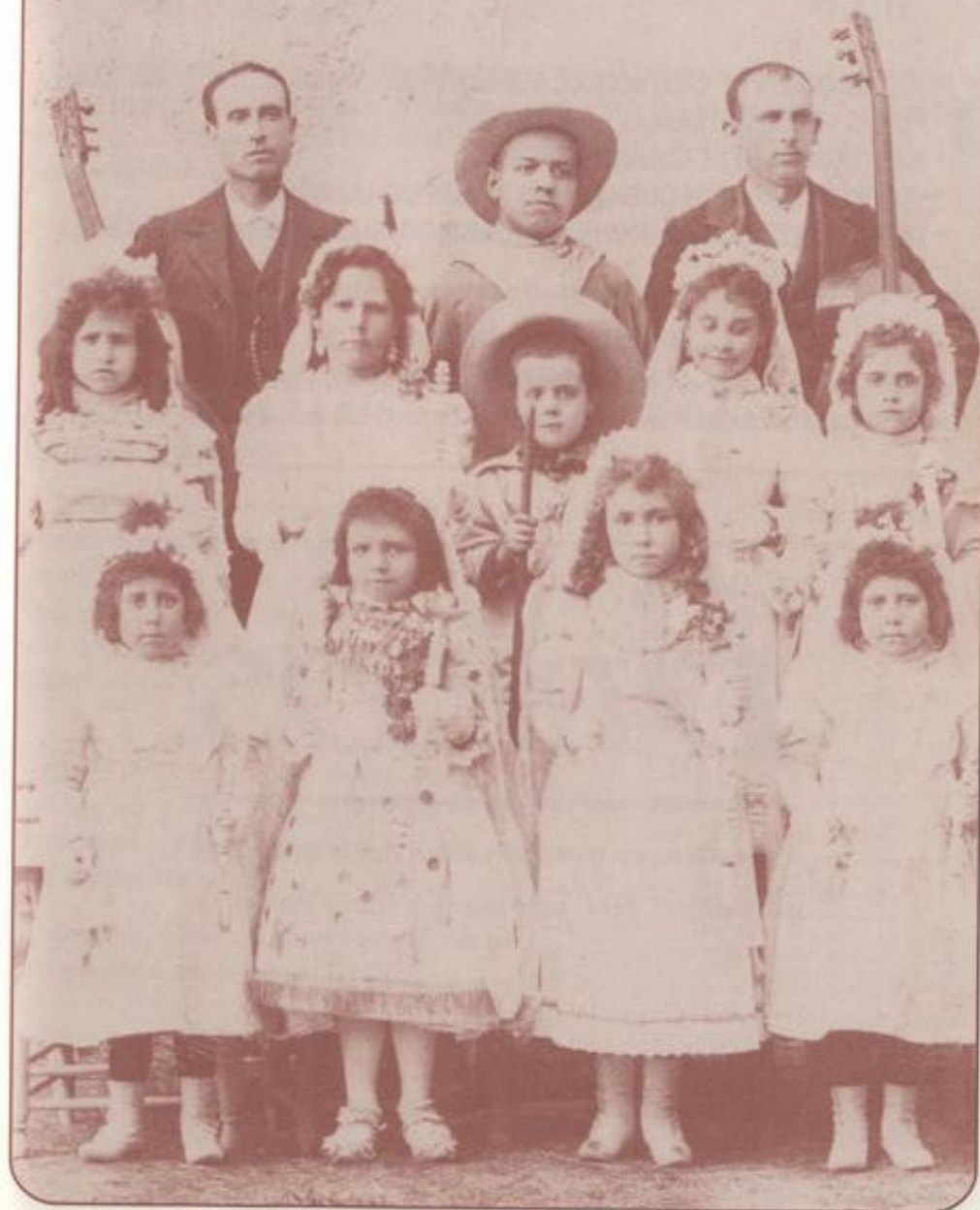
Loa de Pescadoras (año 1900)