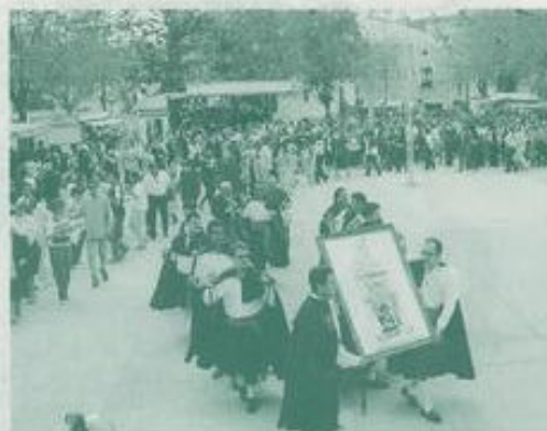
BIBLIOGRAFÍA: ECHEVARRÍA BRAVO, J.,

A.E.Hu., Santa María de Atienza, Cabilde de San Juan, libro de cuentas. En 1646 se gastó "medio arroba para lo primera vez que se juntaron para probar la danza y otra media para otras tres imposturas de la danza". En 1637 se gastaron "62 reales con los danzantes que sacaron las danzas", lo que se podría interpretar con los danzantes que inventaron las danzas, aunque nosotros creemos que se debería traducir por los que bailaron.