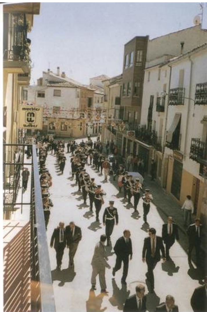
Bandas: Tambores y Cornetas y Música del Bando Central Aéreo (M.A.C.E.N.) 1.ª Región Aérea

Ctra. CM-310, km. 102 Teléf. 371066 16500 HUETE