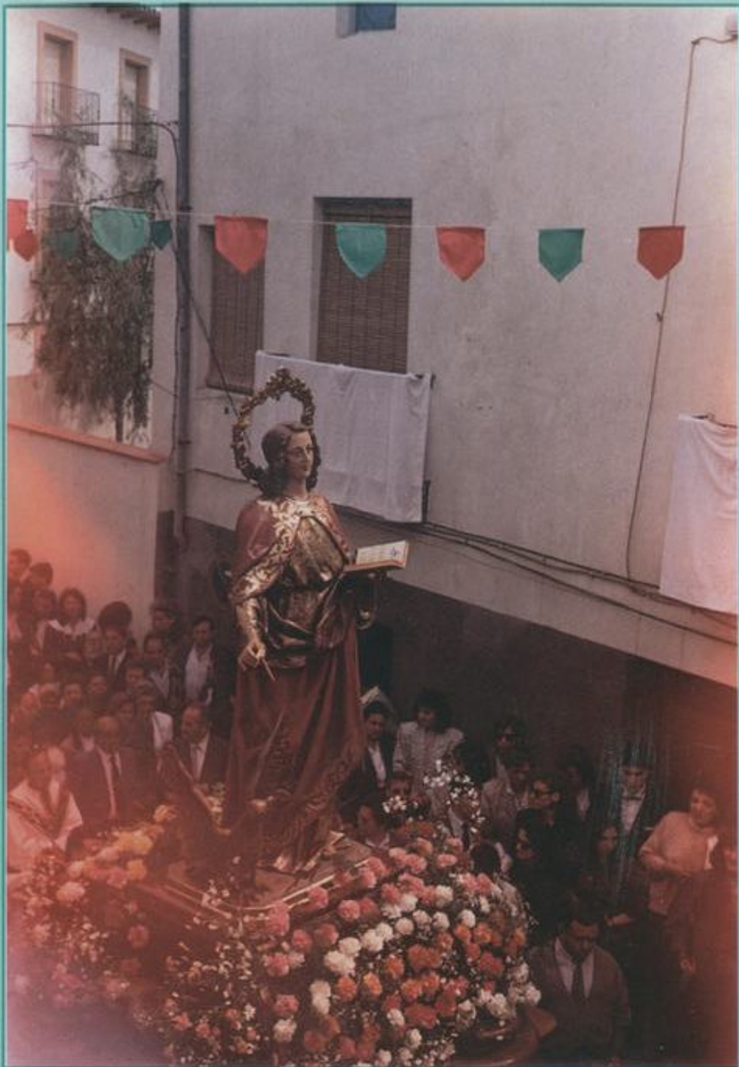
Imagen de San Juan Evangelista, patrón del Barrio de Atienza (Huete)