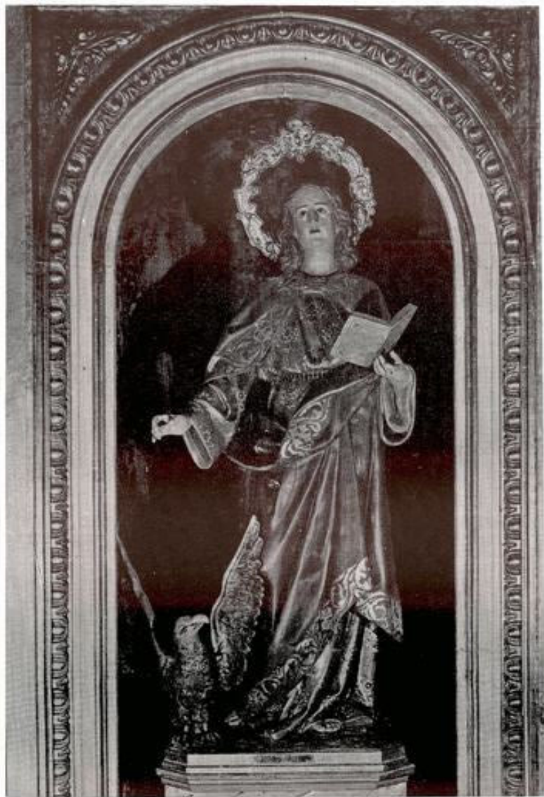
San Juan Evangelista. Patrón.

Pasó el invierno, con nieves en el cabello y vientos azotando cumbres y valles, y la primavera rompió su claustro presentándose, real y tangible, con todo su cargamento de aroma y de esperanza, multiplicando el color de los campos.