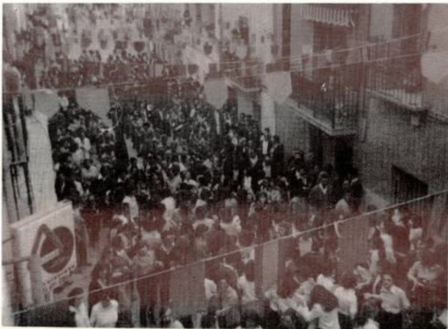
Uno de los "Galopeos".