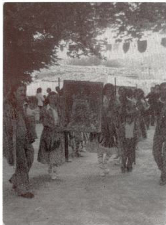
"Danza del Diablo".

El típico baile, ejecutado hoy por una docena de bellas muchachas, quiere escenificar la sempiterna lucha del bien contra el mal. Después de los primeros compases, se inicia un paloteo, lucha entre ambas antagónicas fuerzas, dando paso al prendimiento de Lucifer, diablo principal, que es apresado con un original tejido de cadenas, resultando ahorcado, pero escapando, no obstante, en el último instante, como queriendo prevenir al mundo de su presencia.